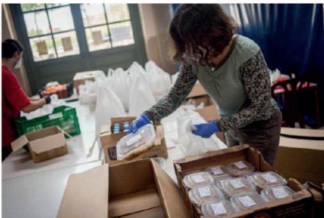
COL·LABORA AME HOSALTPRES